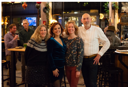
Succes met jullie cadeautje!